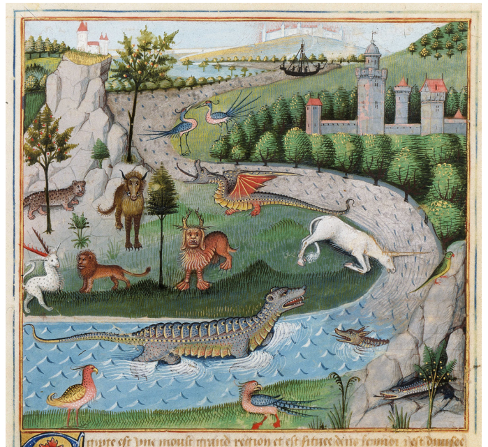
Le secret de l'histoire naturelle contenant les merveilles et choses mémorables du monde, Egypte , 15e