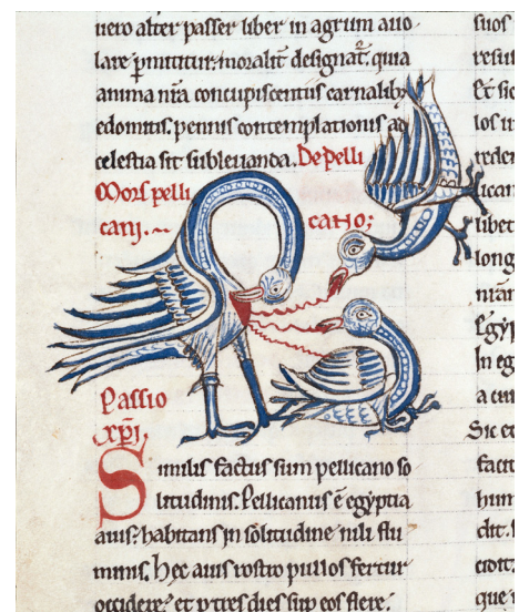
De Avibus, De la nature du pélican , Hugues de Fouilloy, 12e

Les fables, elles, prennent exemple sur la société médiévale, calquant le comportement des animaux sur celui des êtres humains. Elles servent aussi à enseigner une morale. Contrairement aux bestiaires, les histoires qu'elles racontent ne sont pas inspirées des textes religieux mais de la vie quotidienne et de la société médiévale, qu'elles critiquent parfois.