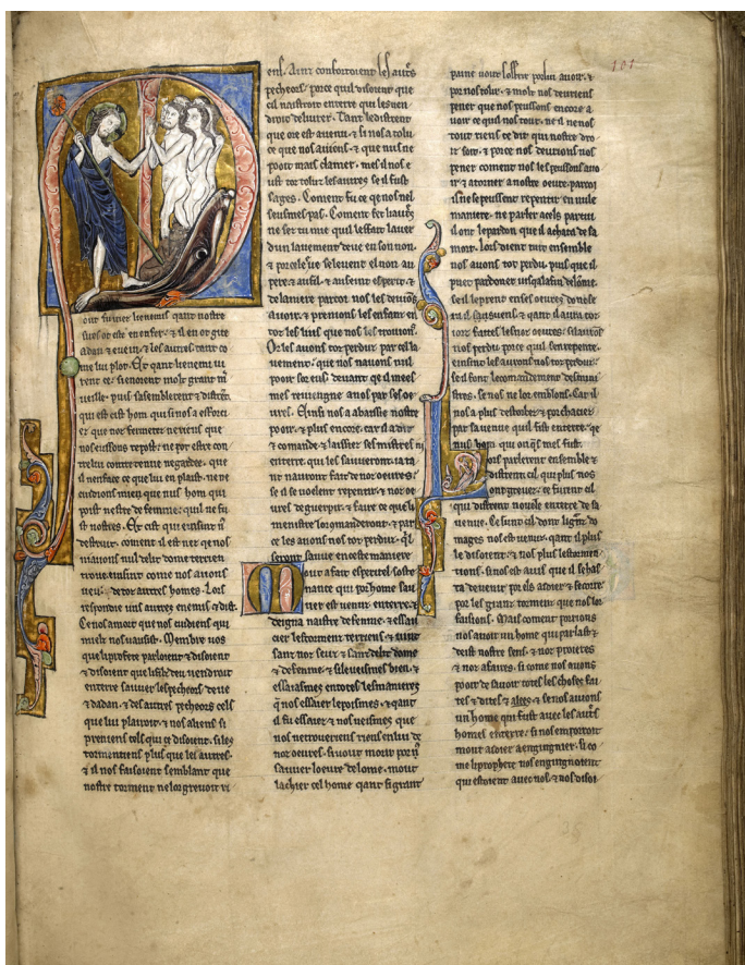
Initiale ornée du Christ aux limbes, Romans de la table ronde , 13e

Les enlumineurs sont des artisans et non pas des artistes : ils apprennent les techniques auprès d'un maître, et ne sont pas entièrement libres dans la réalisation des illustrations. L'enlumineur intervient après le scribe 2 dans la confection du manuscrit, donc le texte est déjà écrit lorsqu'il effectue son travail. La place laissée pour le dessin est restreinte, plus ou moins grande selon la partie du texte concernée (début de chapitre, paragraphe, etc.) et l'enlumineur la remplit à partir d'instructions détaillées laissées par le scribe, le libraire 3 ou le commanditaire. Ces instructions sont laissées sous forme d'indications textuelles ou parfois même d'esquisses. Plusieurs enlumineurs pouvaient participer à l'illustration d'un même manuscrit car ils avaient parfois différentes spécialités : enlumineurs de lettre, enlumineurs de bordures (pour les marges) ou peintre d'histoire (pour les scènes illustrées). Au sein d'un atelier d'enlumineurs, ces spécialités étaient hiérarchisées selon l'ancienneté. Le maître se réservait les illustrations les plus importantes, tandis que les autres enlumineurs et apprentis décoraient les marges et les lettres.