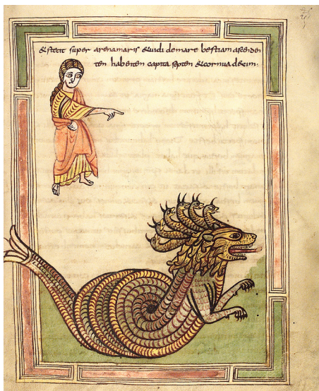
Bête de l'Apocalypse, 9e

Chaque animal a une symbolique spécifique bien connue des populations, transmise par les contes, fables et autres histoires dans lesquelles animaux sont un prétexte pour enseigner une morale. Les bestiaires en particulier servent d'outil de transmission de la morale chrétienne, religion dominante au Moyen Âge. Les animaux y sont classés selon le bestiaire du Christ ou le bestiaire du Diable : il y a les « bons » et les « mauvais » animaux, dont les comportements étaient imaginés en rapport avec les valeurs éthiques de l'époque. Les bestiaires présentent tour à tour chaque animal avec ses caractéristiques christiques ou démoniaques. Héritées à la fois de la Bible et des récits de l'Antiquité, la symbolique de certains animaux peut être ambivalente selon les récits. Elle évolue également au fil du Moyen Âge.