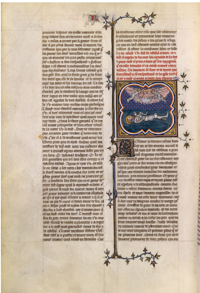
Grandes Chroniques de France de Charles V, La mort de Roland , 14e