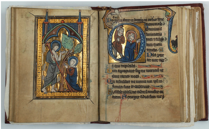
Manuscrit enluminé à la feuille d'or, 13e

Les enluminures, très présentes au Moyen Âge, sont les peintures ou dessins qui accompagnent l'écriture dans les manuscrits. Ayant à l'origine pour rôle de structurer le texte dans le but de faciliter la lecture, elles peuvent avoir une fonction décorative ou illustrative : c'est-à-dire que les motifs représentés peuvent simplement avoir une valeur esthétique ou bien être directement liés à ce que décrit le texte. Dans ce cas-là, les illustrations servent à commenter ou compléter le texte.