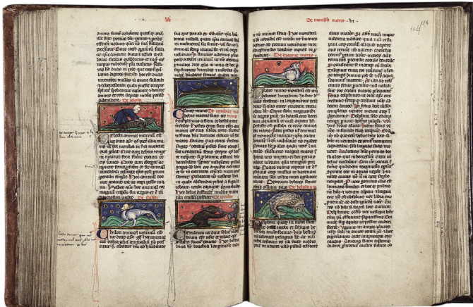
Livre des natures des choses de Thomas de Cantimpré, Monstres marins, dragons et dauphins , 13e

Omniprésents dans le quotidien des hommes et des femmes du Moyen Âge, les animaux sont régulièrement représentés dans les enluminures. Ils viennent détailler les marges ou le fond des illustrations, en décor ou caricature, ou bien occuper la place centrale. Ils sont le sujet principal de trois types de livres : les bestiaires, les fables et les livres de chasse.