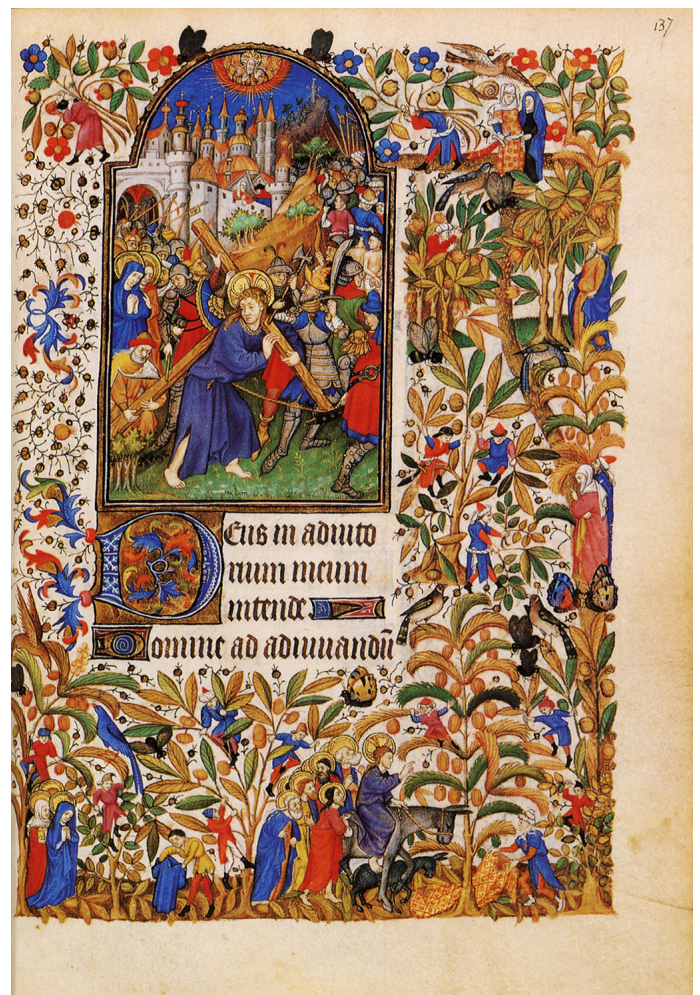
Livre d'heures de Marguerite d'Orléans, Le Portement de croix , 15e