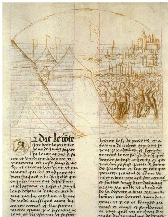
Un exemple d'indication par l'esquisse

Histoire de Merlin, Conseil des saxons , Robert de Borron, enluminée par Jean Colombe, 15e