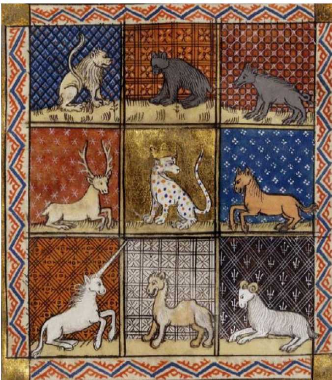
Barthélemy l'Anglais, Livre des propriétés des choses , fin 14e

Les bestiaires et les fables ne montrent pas les animaux de manière réaliste. Ils n'ont pas pour but de renseigner les lecteurs sur les particularités ou les habitudes des espèces. Dans ces récits, l'imaginaire prime sur la réalité, même concernant les animaux les plus communs. De plus, les animaux fantastiques tels que le dragon ou la licorne sont aussi vrais pour les gens du Moyen Âge qu'un cheval ou un cochon.